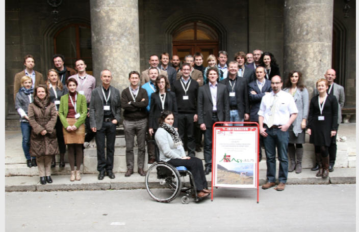
Kick-off Meeting (25.-26.01.2012, Rathaus Wien)

Um Synergien zu nutzen und intersektorale Schnittstellen zwischen gleichzeitig laufenden Klimawandel-Projekten innerhalb des Alpenraumprogramms zu adressieren, hat sich während der Laufzeit von CLISP auf Initiative des UBA ein Klimawandel-Projektcluster gebildet. Im Zuge der Clusteraktivitäten wurde deutlich, dass der Bedarf nach sektorübergreifender Abstimmung von Maßnahmen zur Anpassung und nach Nutzbarmachung des vorhandenen Wissens am geeignetsten durch ein gezieltes Projekt zu Wissenssynthese, Transfer und pilothafter Umsetzung befriedigt werden kann. Aus dieser Motivation heraus wurde die Projektidee von C3-Alps entwickelt. C3-Alps verfolgt das Ziel, das bestehende Wissen über Klimawandelfolgen und Anpassung an den Klimawandel im Alpenraum aufzubereiten, für Entscheidungsträger nutzbar zu machen und es in Wert zu setzen.