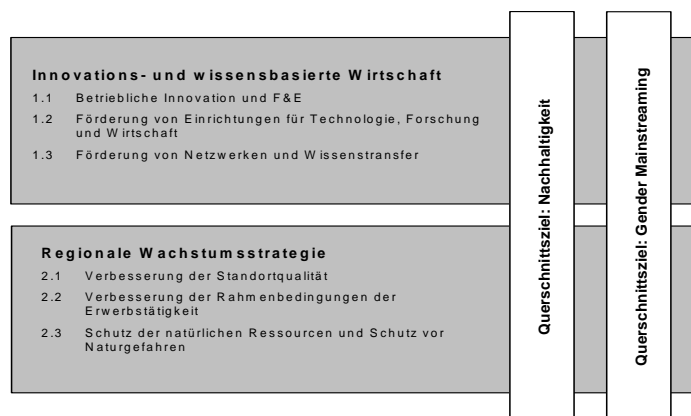
Abbildung Schematische Darstellung der Prioritätsachsen, Aktionsfelder und Querschnittsziele