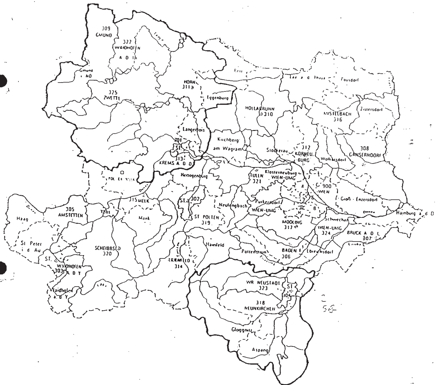
Abbildung 1: RETEX-Förderungsgebiet in Niederösterreich

Abbildung 1 illustriert die Lage der RETEX-Förderungsgebiete in Niederösterreich