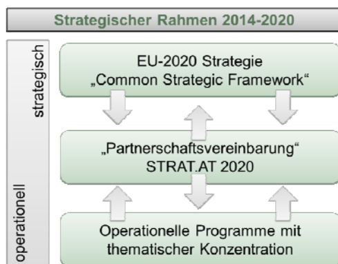
Abb 2.: Multilevel Governance 2014-2020

Den bisher veröffentlichten Verordnungsvorschlägen (Stand August 2012) zu Folge soll die Kohäsionspolitik 2014+ noch stärker mit den Zielen der Europa 2020-Strategie in Einklang gebracht werden. Der von der EU vorgegebene strategische Rahmen wird durch die Strategie „Europa 2020“, dem „GSR“ (Gemeinsamer Strategischer Rahmen) und die fondsspezifischen Verordnungen beschrieben. Die nationale Umsetzung der Kohäsionspolitik wird im Rahmen der rechtlich verbindlichen „Partnerschaftsvereinbarung“ über die Förderperiode 2014+ definiert. In Österreich wird die Partnerschaftsvereinbarung im Rahmen des „STRAT.AT-2020 Prozesses“ entwickelt und erarbeitet. Die operationellen Programme müssen mit den übergeordneten Zielen der EU bzw. den nationalen Zielen („STRAT.AT-2020 Prozess“, Partnerschaftsvereinbarung) im Einklang stehen (siehe Abb. 2).