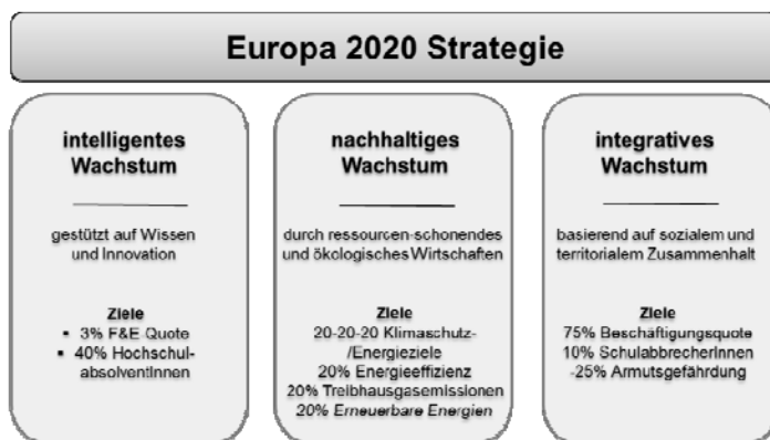
Abb. 1: Europa 2020 Strategie – Prioritäten und Ziele

Nach Hälfte der Laufzeit der „Lissabon-Strategie“ wurde der Fokus auf Wachstum und Beschäftigung verstärkt und Rahmenbedingungen geschaffen, die die Einbindung der Mitgliedsstaaten bei der Umsetzung der Strategie erhöhen sollte. Basierend auf den Erfahrungen mit der langsamen Umsetzung dieser Strategie und unter dem Druck der Wirtschaftskrise der Jahre 2008/2009 wurde eine neue Wachstums- und Beschäftigungsstrategie - „Europa 2020“ 2 - erarbeitet und im Juni 2010 vom Europäischen Rat angenommen. Mit der „Europa 2020-Strategie“ soll nun der Übergang zu einer wissensbasierten, grünen und inklusiven Marktwirtschaft beschleunigt werden. Intelligentes, nachhaltiges und integratives Wachstum sind die Eckpfeiler dieser Strategie, dementsprechende Ziele wurden formuliert (siehe Abb. 1).