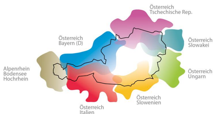
Abb.4 1: Bilaterale ETZ-Programme mit österreichischer Beteiligung 2007-2013

Für die ETZ Programme stehen in Österreich für die Periode 2007–2013 rund 257 Mio. Euro zur Verfügung, wobei der überwiegende Anteil auf die grenzüberschreitenden Programme österreichischer Regionen mit den neuen Mitgliedsstaaten entfällt.