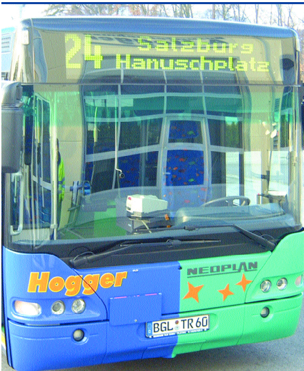
Grenzüberschreitende Eilbuslinie Nr. 24 zwischen den Zentren Freilassing und Salzburg