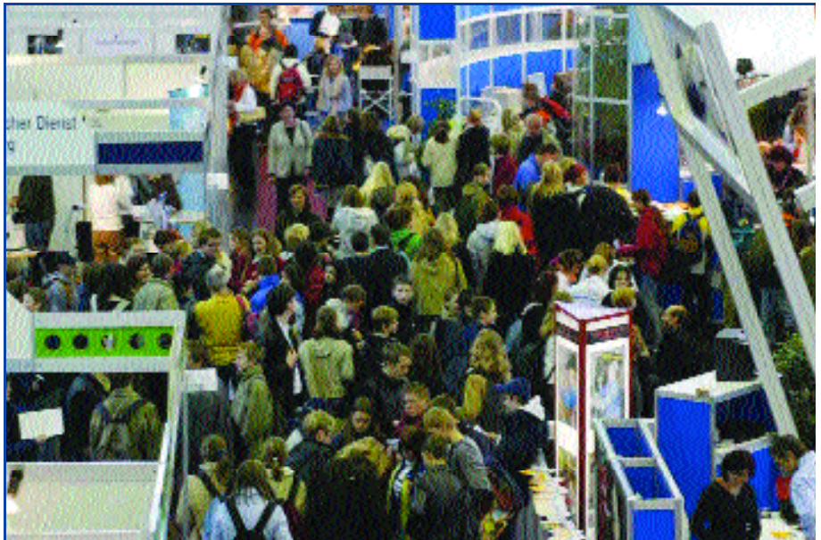
Berufsinformationsmesse BIM, grenzüberschreitendes Angebot für bayerische und Salzburger Schüler im Salzburger Ausstellungszentrum

Eine Besonderheit dieser Region ist der grenzüberschreitende Ballungsraum. Dies wurde auch in der bayerischen Landesplanung durch die Berücksichtigung der grenzüberschreitenden Verflechtung im LEP Bayern anerkannt.