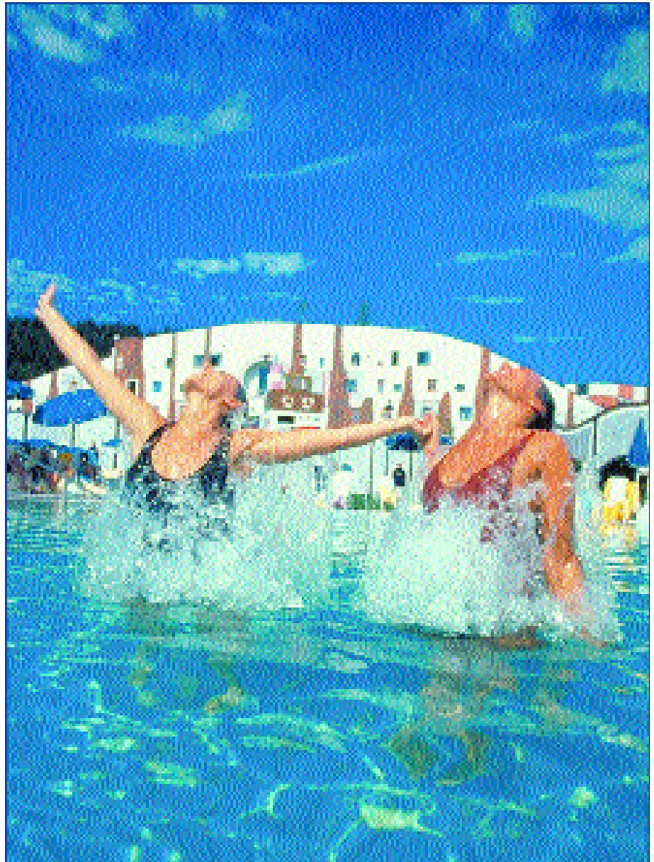
Thermentourismus – eine der Stärken der Region Oststeiermark

GO BEST entstand in sechs Arbeitskreisen, in denen alle wichtigen regionalen Einrichtungen und AkteurInnen mitwirkten. In so genannten Entwicklungszellen wurden betroffene BürgerInnen und Untemehmen eingebunden und somit nicht nur die üblichen VerantwortungsträgerInnen sondern wirklich Betroffene (z. B. GründerInnen, Nebenerwerbsbauern, Suchtkranke ...) und deren Bedarfe miteinbezogen. Die Steuerung und Abstimmung erfolgte in Koordinationstreffen, bei denen auch die