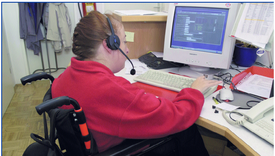
Bedarfsgerechte Beschäftigung für alle ist ein zentrales Anliegen von GO BEST

Förderprogramme (z. B. Regionale Wettbewerbsfähigkeit und Beschäftigung, Transnationale Kooperation etc.) zu etablieren.