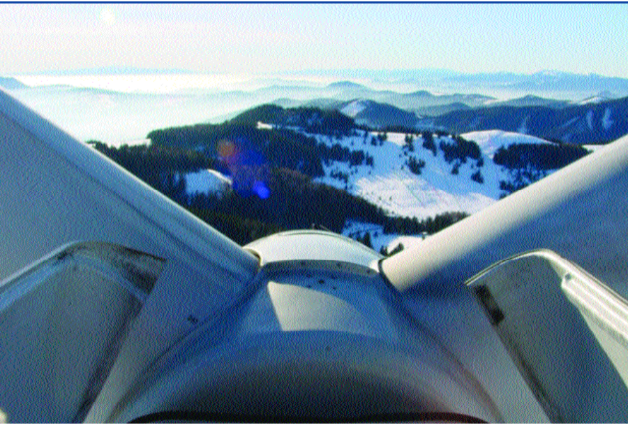
GO BEST sorgt für frischen Wind in der Oststeiermark

Fachabteilungen der Stmk. Landesregierung, das AMS und die Gender Mainstreaming Beauftragte des oststeirischen Beschäftigungspaktes teilnahmen.