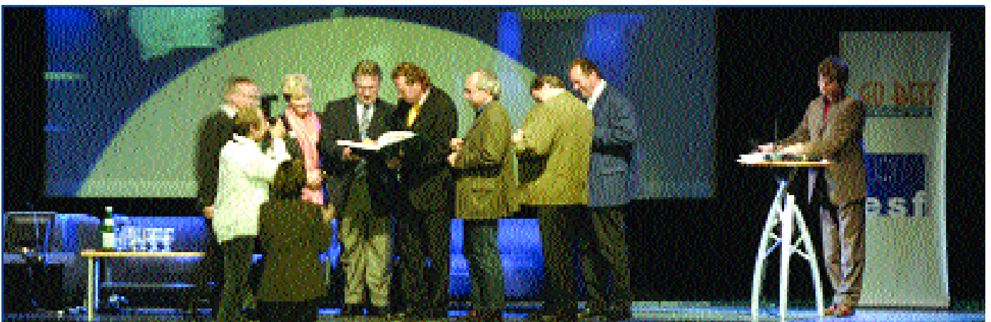
LandespolitikerInnen aller Parteien und der Vorsitzende des Regionalmanagements präsentieren die oststeirische Zukunftsstrategie GO BEST