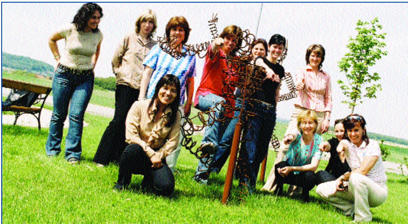
Die geografische und berufliche Mobilität soll gesteigert werden

Strukturen und die optimale Nutzung von lokalem Know-how. Zusätzlicher Mehrwert ergibt sich durch die Einbindung von zwei Partnerorganisationen aus Ungarn und der Slowakei