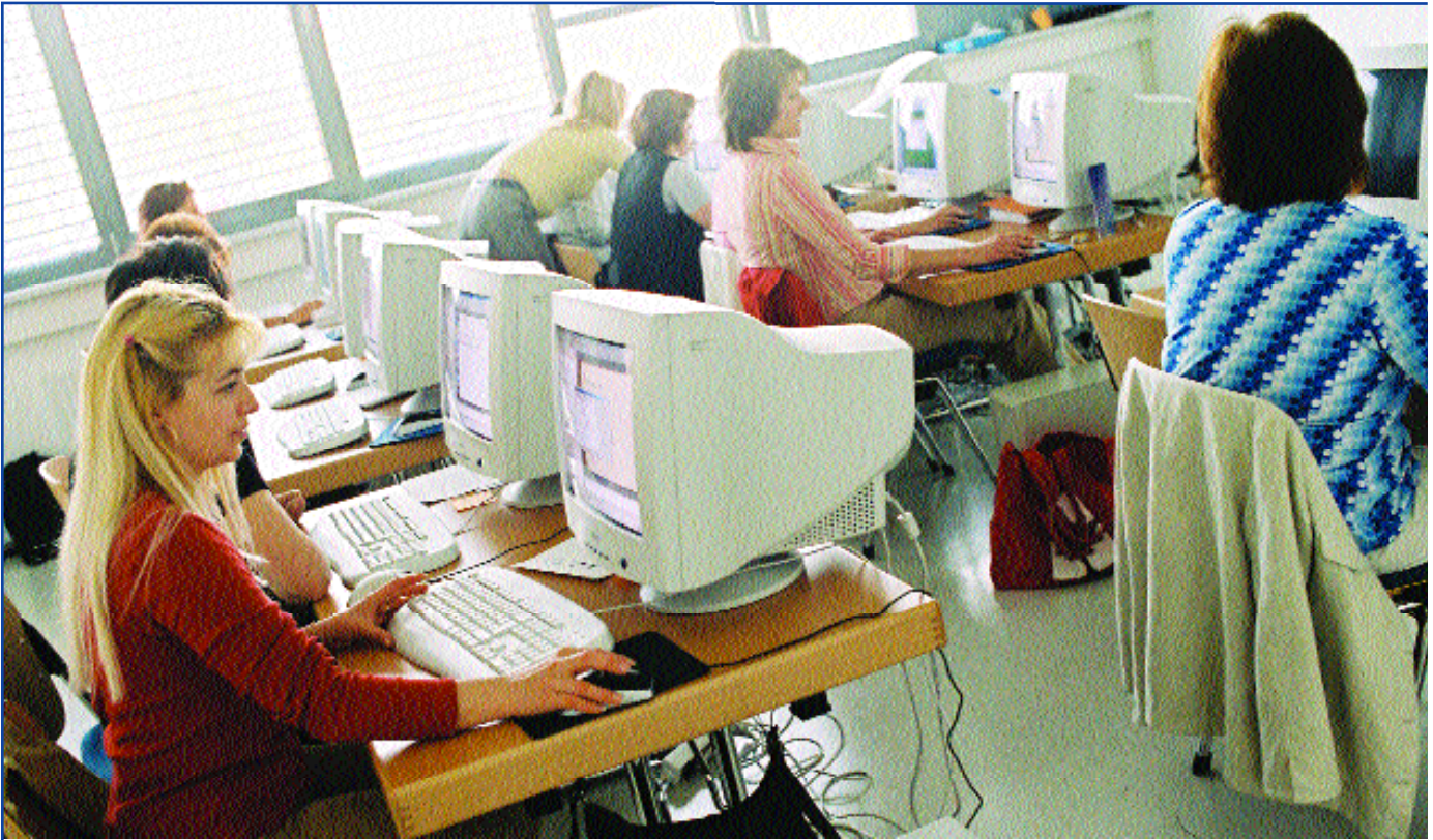
Lebensbegleitendes Lernen und ständige Weiterbildung sind die Grundvoraussetzungen für den Erwerb und Erhalt des Arbeitsplatzes