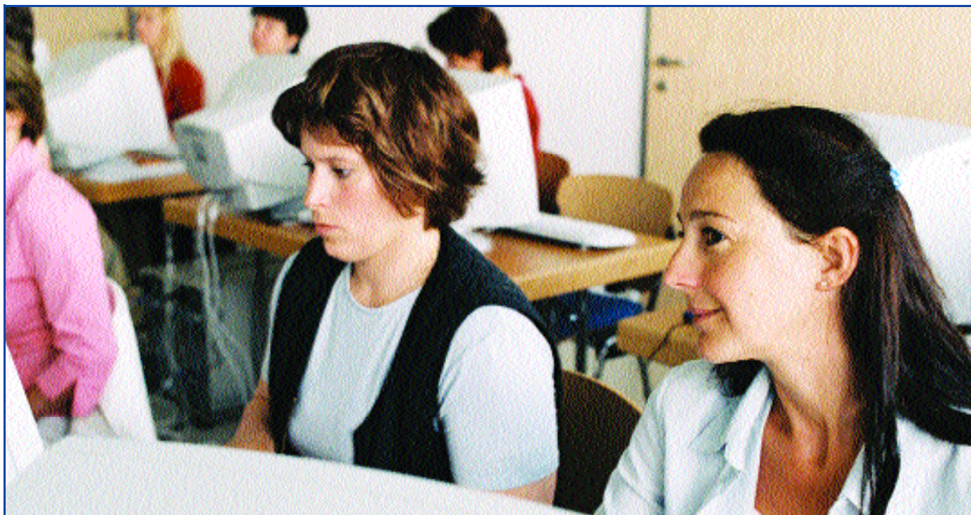
Bedarfsgerechte Weiterbildungskurse mit modernen und erwachsenengerechten Lernformen werden angeboten