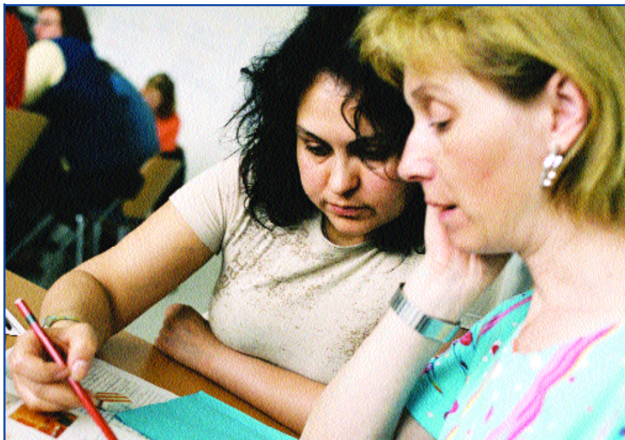
Qualifizierungskurse erhöhen die Chancen für die Frauen am Arbeitsmarkt

Unternehmenskooperationen: abz.femobile qualifiziert Frauen bedarfsgerecht nach den Anforderungen der lokalen Unternehmen.