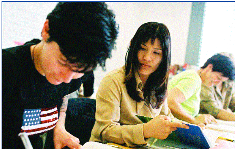
Kostenlose Weiterbildungsmodule helfen beim (Wieder-)Einstieg ins Berufsleben

Zielgruppe von abz.femobile sind daher niedrig qualifizierte Frauen. Die inhalt-