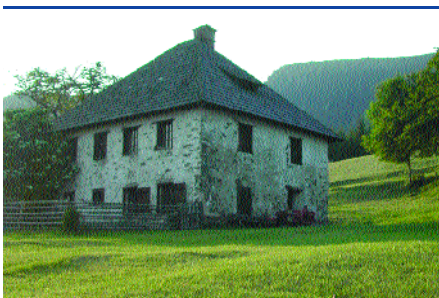
Höfsanierungen sind geplant