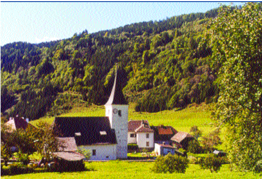
Im Zentrum der Ortskern Ingolsthalmassiv