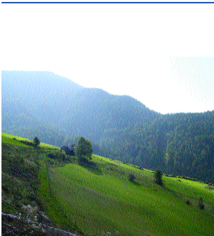
Die Almen werden bewirtschaftet