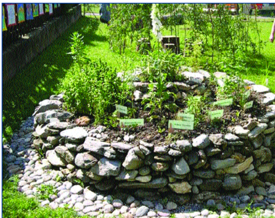
Die Kräuterspirale wurde von den SchülerInnen der Volksschule angelegt