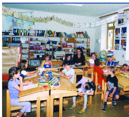
Soziales Lernen wird in Ingolsthal gelebt