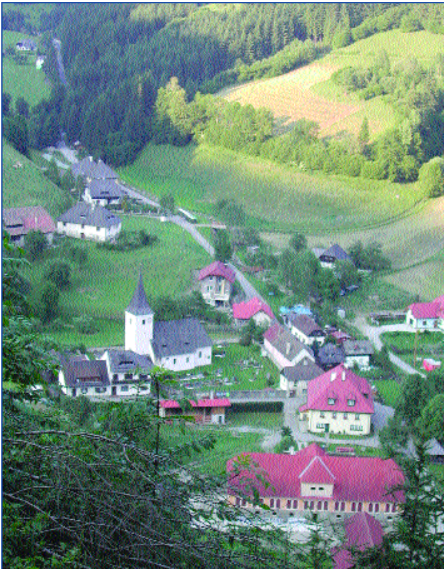
Ingolsthal ist eingebettet in die umgebende Natur- und Kulturlandschaft

Um diesen negativen Trend zu stoppen und der Entwicklung und den Problemen in Ingolsthal entgegenzuwirken, hat sich eine Gruppe engagierter BürgerInnen zusammengeschlossen und die Arbeitsgemeinschaft Ingolsthal-Aktiv gegründet. Mit professioneller Unterstützung durch das Regionalmanagement Mittelkärnten wurde eine LEADER-Arbeitsgruppe gegründet und mit dem Projekt „ARGE