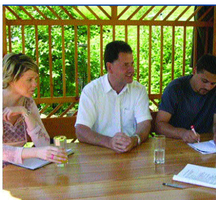
Miteinander werden Ideen entwickelt und umgesetzt