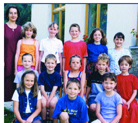
SchülerInnen der vier Schulstufen in einer Klasse