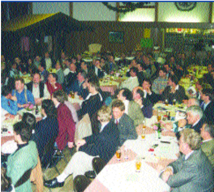
Mit großem Interesse startete die Region 1996 in die Erfolgsgeschichte ...