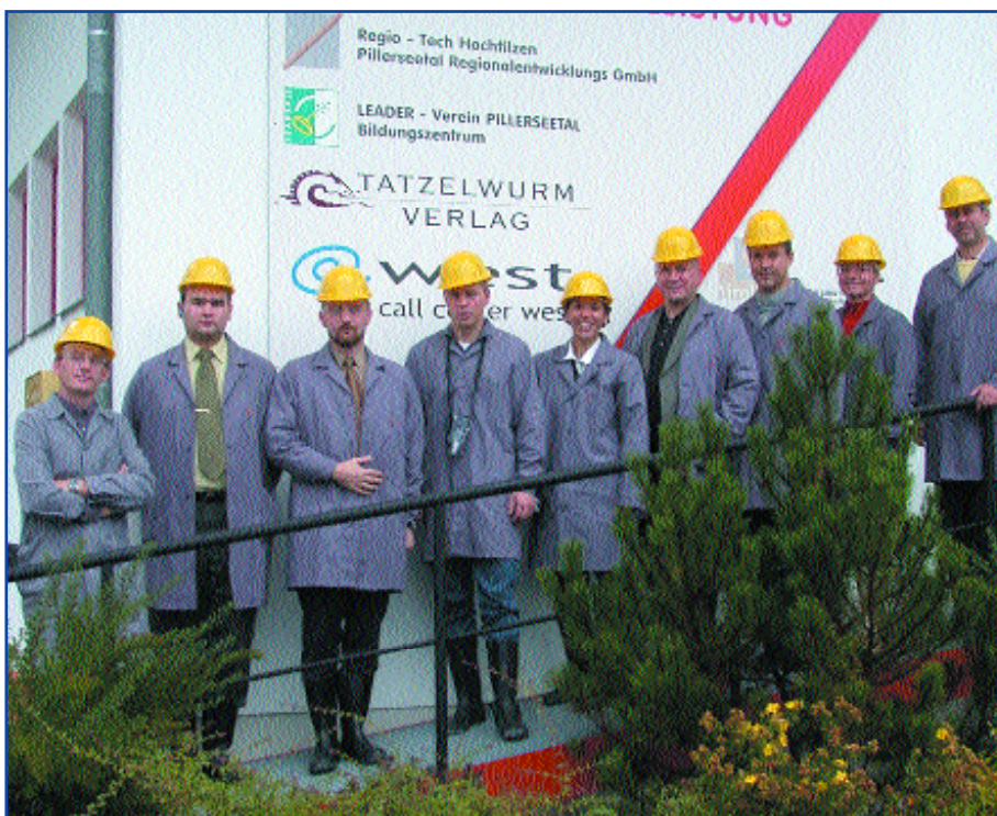
Vertreter einer russischen Delegation beim Besuch im Regio-Tech, Hochfilzen

Am Planungsprozess beteiligt waren Vorstand und Geschäftsführung des LEADER-Vereins und die Gemeinden der Region