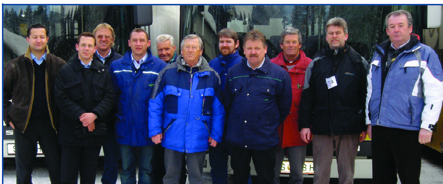
Die Pillerseetal-Regionalentwicklungsgesellschaft übernahm die gesamte Shuttlebus-Logistik anlässlich der Biathlon-WM 2005 (von der Ausschreibung über die Fahrplanlogistik bis zur Finanzierung)

Pillerseetal. Die Salzburger Gemeinde Leogang (ab LEADER+ in die Region integriert) und der Verein KOM Thiersee (ein im Rahmen des Ziel-5b-Programms unter Federführung des LEADER-Pillerseetal-Geschäftsführers entstandenes Ausbildungszentrum) ergänzten die kontinuierliche Weiterentwicklung.