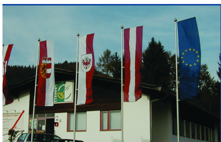
Regio-Tech Hochfilzen – Haus der Region, Regionales Bildungszentrum und Gründer-/Innovationszentrum. Das Gebäude wird 2005–2006 ausgebaut und deutlich erweitert

LEADER-Bildungsoffensive durch Installation eines „Telezentrums“