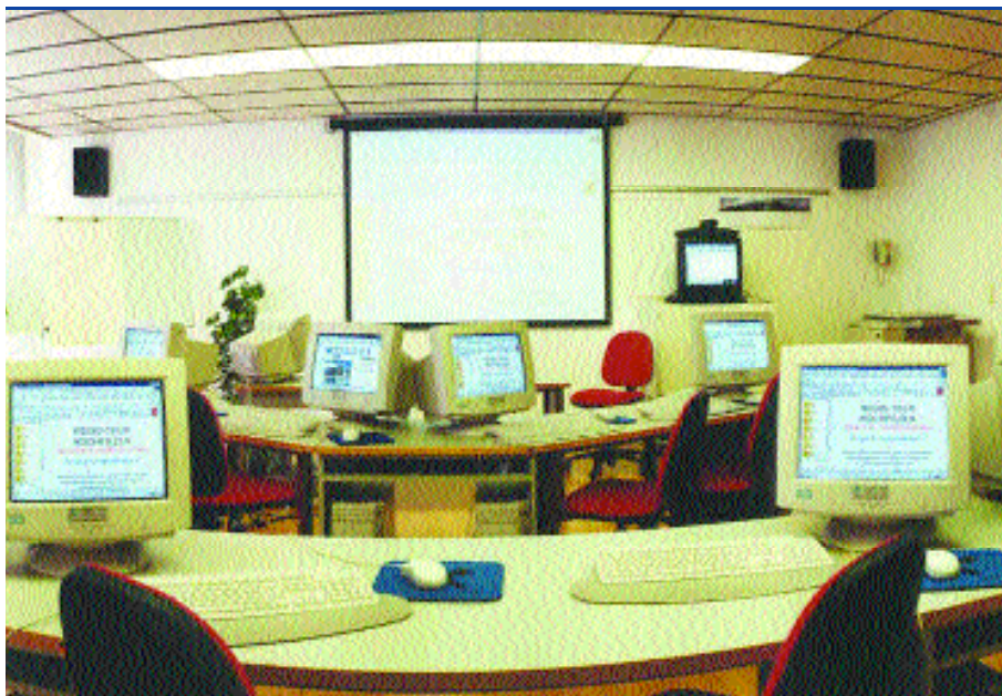
Seminarraum Regio-Tech Hochfilzen