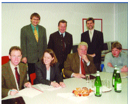
Vertreter der Salzburger und Tiroler Landesregierung, der LAG und der neu beigetretenen Salzburger Gemeinde Leogang