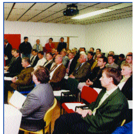
Eröffnung Regio-Tech