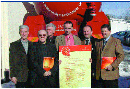
Der Qualitätsverbund Biomasse – Heizen mit Holz wird von den Regionsvertretern präsentiert

Die 16 Gemeinden der Buckligen Welt im südlichen Niederösterreich haben im Jahr 2000 beschlossen, dem Klimabündnis beizutreten. Neben den ökologischen Zielsetzungen sollen dabei jedoch auch für die Region passende, wertschöpfende Akzente gesetzt werden. Aufgrund der kleinräumigen landwirtschaftlichen und kleingewerblichen Struktur der Region sieht die Bucklige Welt im Bereich der Ökoenergie (Biomasse, Biogas, Wärmedämmung etc.) be-