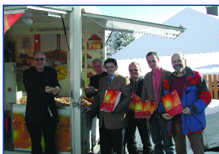
Mitgliedsbetriebe des Qualitätsverbundes Biomasse – Heizen mit Holz präsentieren sich

Insgesamt wurden so rund 30 konkrete „Umweltprojekte“ entwickelt und mit Unterstützung des Landes Niederösterreich umgesetzt. Die Unterstützung von „Klimabündnisregionen“ ist eine vom Land Niederösterreich initiierte und