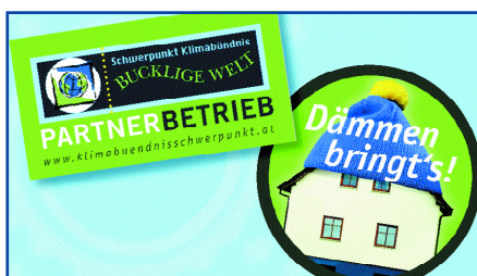
Regionale Betriebe als Partnerbetrieb bei der Aktion „Dämmen bringt's“

geförderte Aktion (NÖ-Klimastrategie, NÖ-Nachhaltigkeitsstrategie).