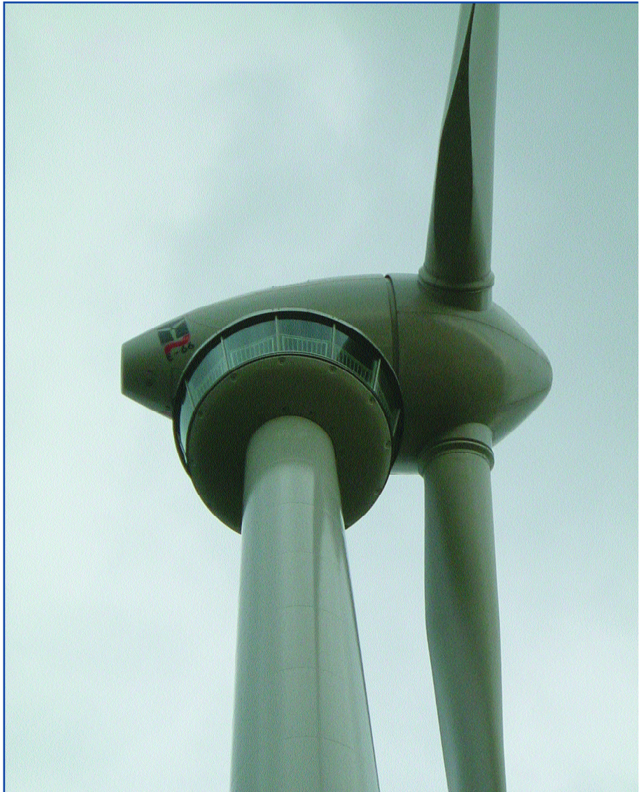
Das Windrad mit Aussichtsplattform in Lichtenegg zieht nunmehr auch Touristen an

Vorbildhafte Umweltprojekte der Regionsgemeinden sollen nicht nur der prakti-