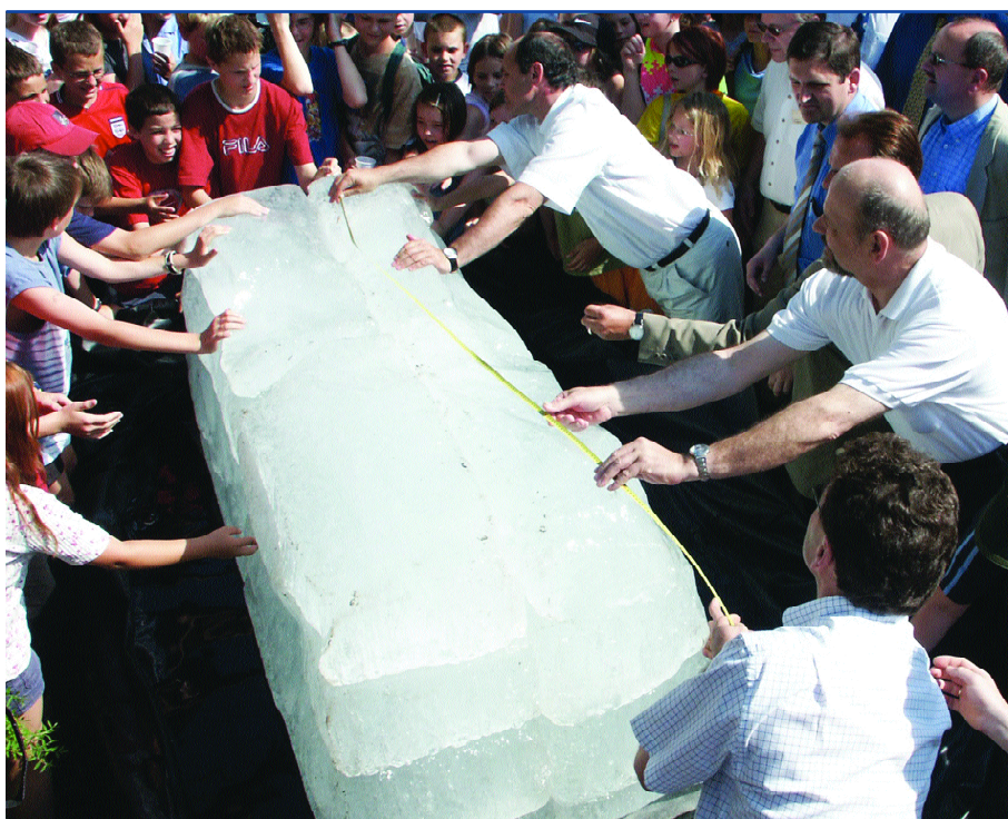
Ein in zeitgemäßer Wärmedämmung eingehüllter Eisblock wird nach drei Monaten wieder enthüllt und zeigt damit die Wirkung des Dämmmaterials – 75 % waren noch übrig!