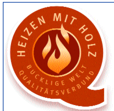
Logo des Qualitätsverbund Biomasse – Heizen mit Holz

Durch diese prozessorientierte Vorgangsweise gelang es vorbildlich, die Kräfte vor Ort zu bündeln und Synergien zu schaffen.