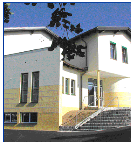
Öffentliche Gemeindegebäude werden mustergültig saniert und haben somit Vorbildwirkung

beirat (BürgermeisterInnen und VertreterInnen des Landes NÖ) abgestimmt.