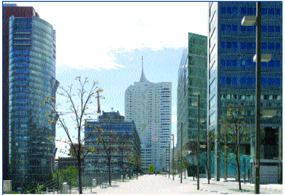
Wien – Donaucity mit Andromedatower