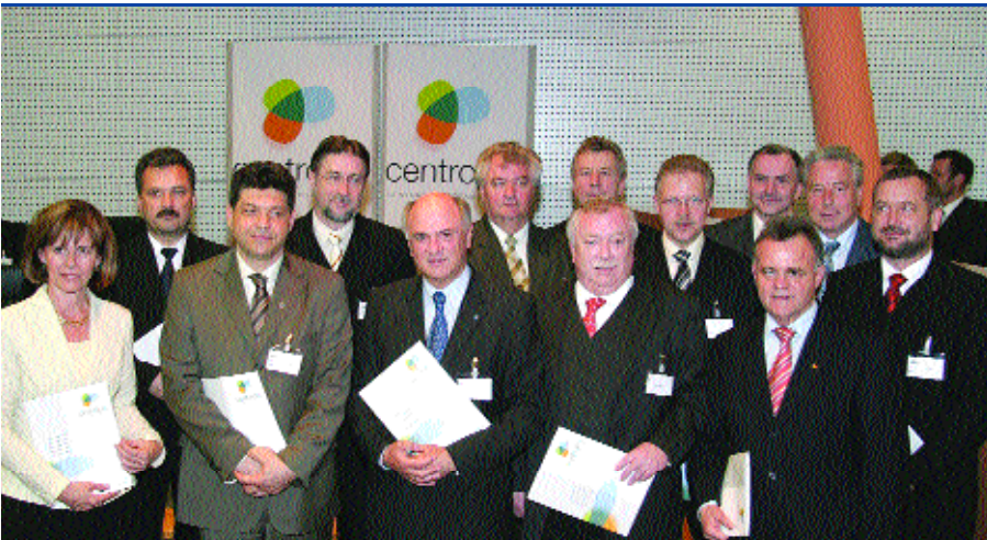
Landeshauptleute, Komitatspräsidenten und Bürgermeister bei der CENTROPE-Konferenz „Wir wachsen zusammen. zusammen wachsen wir“, St. Pölten, 19. April 2005

Praxisbezug einbringen und gemeinsam notwendige Strategien und Entwicklungsschritte beraten.